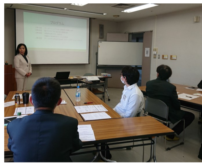
▲異業種の方々との交流の場となり、視野が広がります